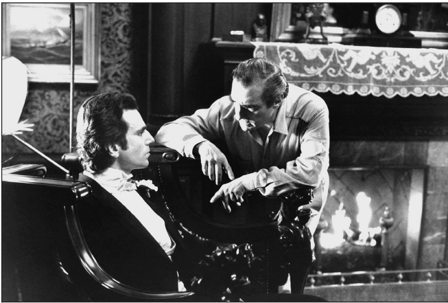
Abb. 3: The Age of Innocence (1993)

Es hatte die gleichen Hintergründe, die gleichen musikalischen Vorlieben zum Beispiel, die gleichen Erfahrungen und die gleichen Interessen, nämlich, um es pathetisch zu sagen, eine Neuerfindung des (amerikanischen) Kinos wie der Filmemacher. Die Nähe zwischen den drei Beteiligten, den Filmemachern, der Kritik und dem Publikum, gehört zu den Glücksfällen der Filmgeschichte, vergleichbar dem italienischen Neorealismus, der Nouvelle Vague in Frankreich, für einen kurzen Moment auch dem neuen deutschen Film. Prekär freilich ist diese Beziehung deshalb, weil eine solche virtuelle Gemeinde eine Anspruchs- und Erwartungshaltung generiert, die nicht minder re-