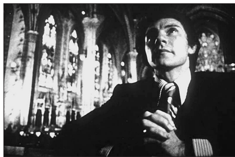
Abb. 4: Harvey Keitel beim Beten in Mean Streets (Hexenkessel)

Vielleicht kann man, sehr grob gesprochen, die erste Hälfte der Arbeit Scorseses bezeichnen als Versuche über Menschen, die mit einer Anzahl Sünden leben, und die zweite Hälfte, sozusagen von der Schattenseite aus gesehen, darüber, wie Menschen mit der Sünde nicht mehr leben können. (Abb. 4)