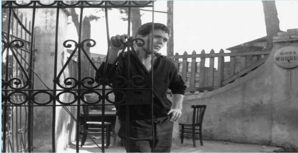
ACCATTONE - Italien 1961 Regie: Pier Paolo Pasolini

ITA 1961, 115 Min., dig. Proj., dt F., R.+ B.: Pier Paolo Pasolini, K.:Tonino Delli Colli, S.:Nino Baragli; mit Franco Citti, Franca Pasut Paola Guidi