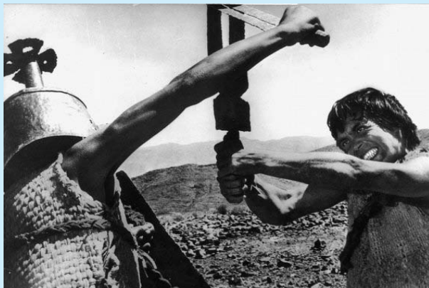
EDIPO RE - Italien 1967 Regie: Pier Paolo Pasolini

ITA 1961, 115 Min., dig. Proj., dt F., R.+ B.: Pier Paolo Pasolini, K.:Tonino Delli Colli, S.:Nino Baragli; mit Franco Citti, Franca Pasut Paola Guidi